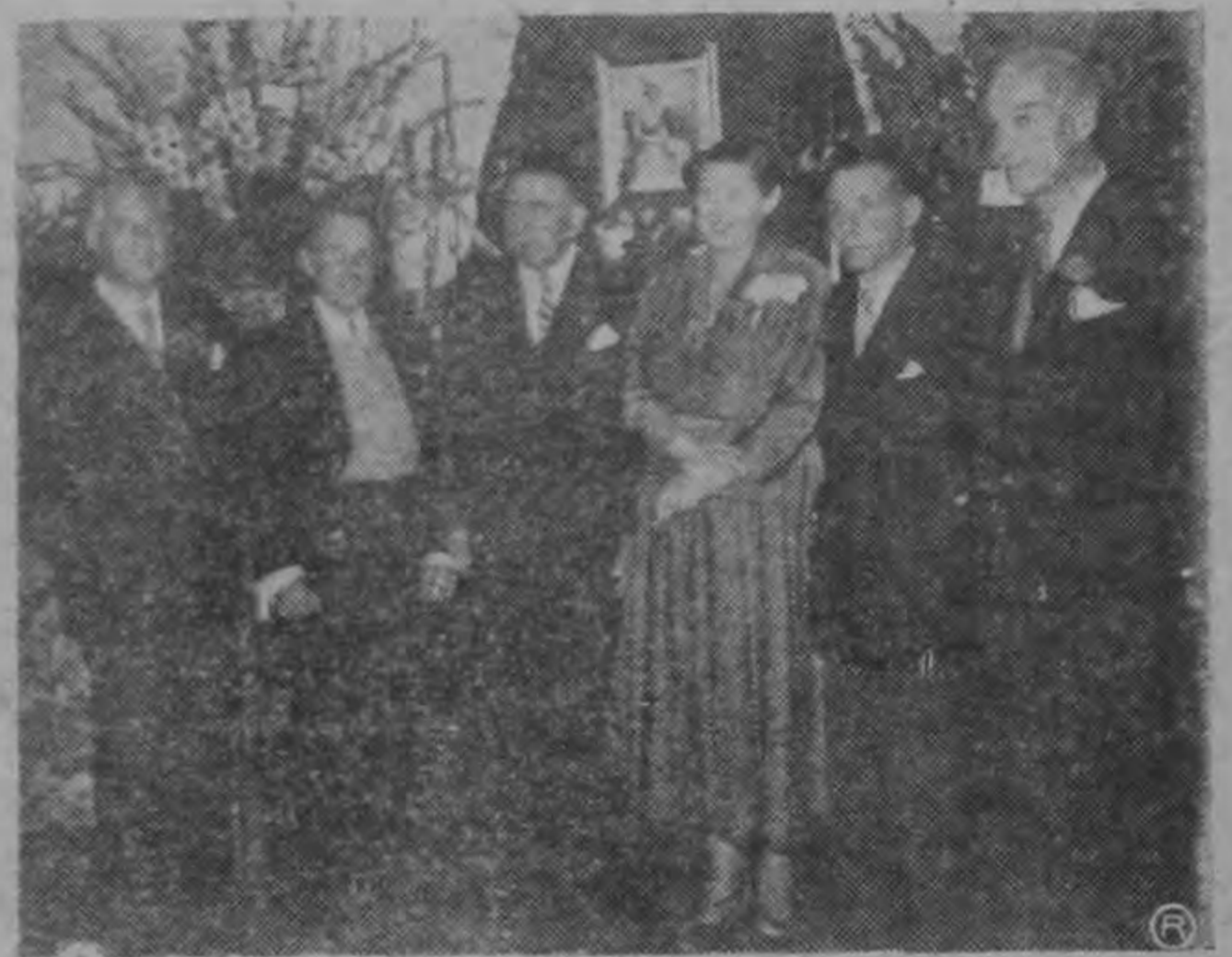
Con asistencia del señor Presidente de la República, don Otilio Ulate, y del Ministro de Relaciones Exteriores, don Fernando Lara Bustamante, se realizaron, en nuestra capital, las actuaciones oficiales con motivo de la Coronación de S. M. Isabel II de Inglaterra. En primer término, saliendo de la Iglesia Anglicana en compañía del Ministro de Gran Bretaña y del Secretario de la Legación Británica ; y, en segundo, un aspecto de la recepción ofrecida en la Legación: están, también el Ministro de Educación, doctor don Virgilio Chaverri, y la esposa del Ministro de Gran Bretaña.