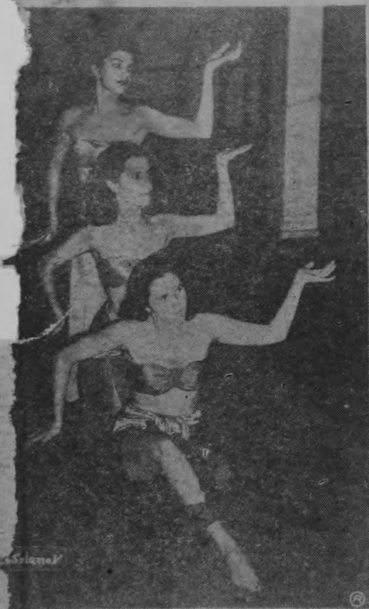
BALLET.—Dos aspectos de los ensayos que están realizando las señoritas de la Escuela de Baile Grace Lindo para participar en las funciones que ofrecerá en el Teatro Nacional "Les Ballets de Francie", bajo la dirección de Mademoiselle Françoise Alauze. A la izquierda, tres damitas en un ejercicio; a la derecha, una de ellas en una bella pose que el capriño fotográfico de Solano ha transformado en gracioso vuelo.