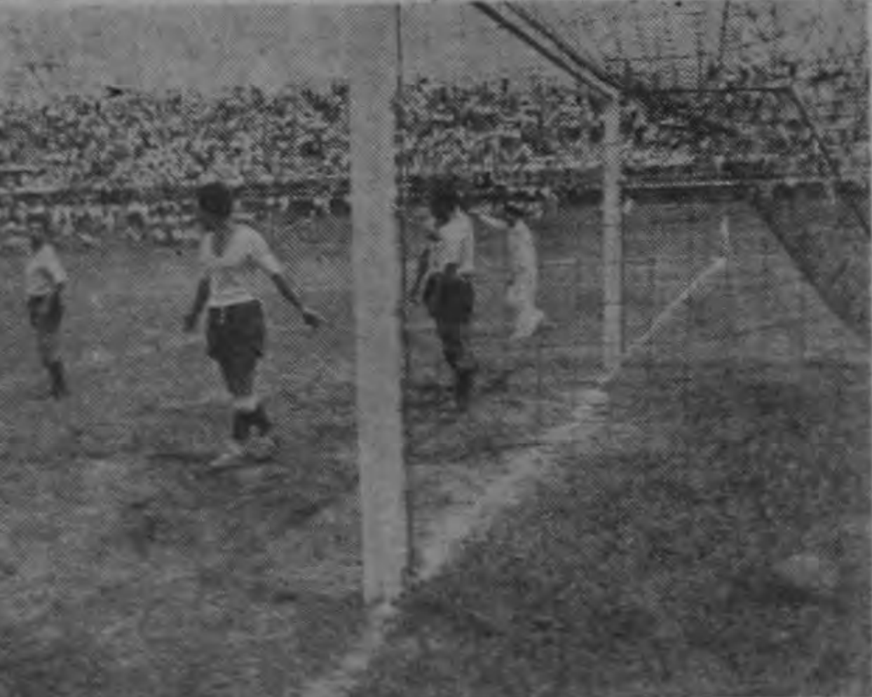
El goal que marcó Valenciano el domingo contra Sport Boys. Los visitantes ganaron a Saprissa por dos tantos a uno.